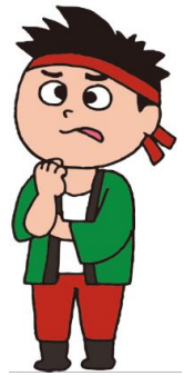
老朽住宅除却のジョー