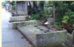
地震により、倒壊したブロック塀 (平成19年 新潟県中越前地震)

人は、とっさに物陰へ身を寄せると と言われており、地震が起きれば ブロック塀に身を寄せることが考 えられます。ブロック塀の安全を 点検し、災害に備えましょう!